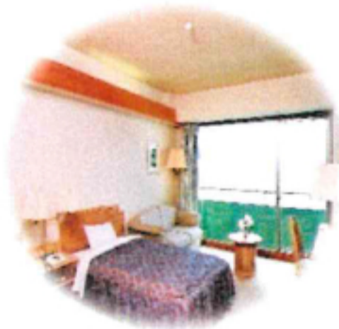
客室風景(イメージ)