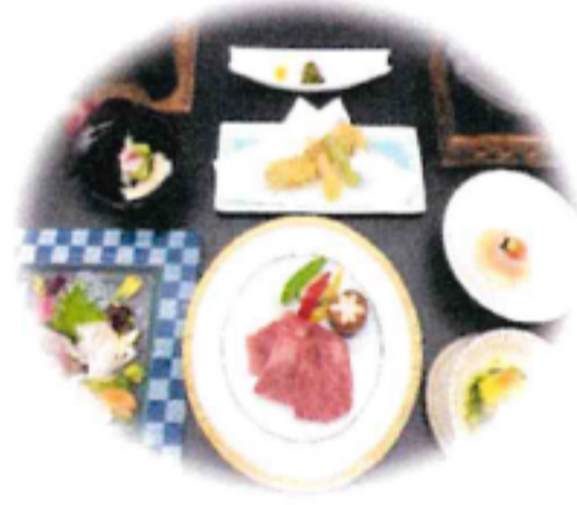
夕食料理写真(イメージ)