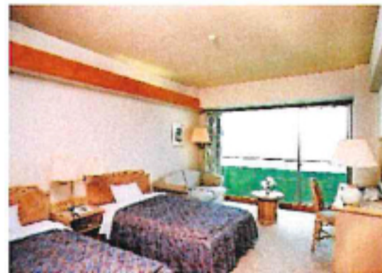
客室風景(イメージ)