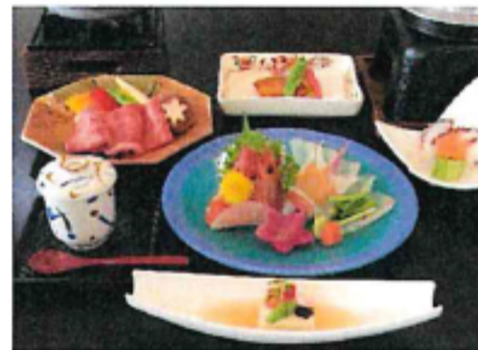
夕食料理写真(イメージ)