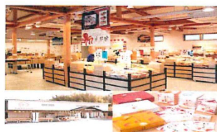
★えびせんパーク本店