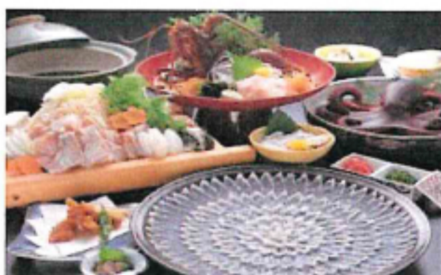
夕食料理写真(イメージ)