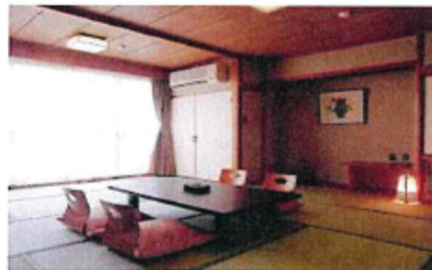
客室風景(イメージ)