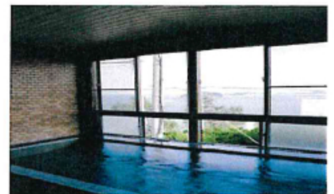
大浴場 ※温泉ではありません