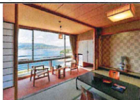
客室風景(イメージ)