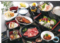
夕食料理写真(イメージ)