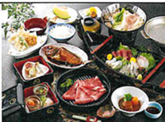
夕食料理写真(イメージ)